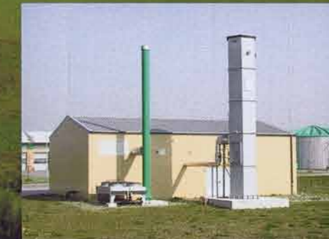
Blockheizkraftwerk mit Schornstein und Fackel (7)