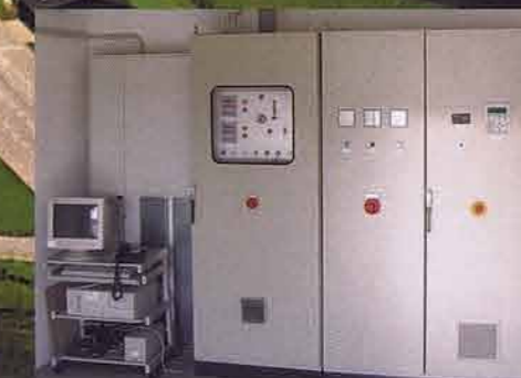
Schalt- und Kontrollraum Gasfassung (8)