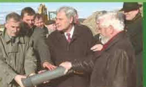
Grundsteinlegung am 19.2.2004